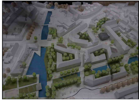
Die Zukunft: Die siegreiche Variante C für die Unterstadt

Die Rathausrenovierung kann die Stadt selbst durchführen über die neue GSK. Für die übrige Bebauung brauchen wir lediglich einen Bebauungsplan auf der Grundlage der Variante C. Ein jetzt vorgesehener Investorenwettbewerb ist nicht nur überflüssig, sondern auch schädlich. Textilanbieter, Banken oder Hoteliers, die selber bauen wollen, kommen in einem solchen Wettbewerb nicht zum Zuge.