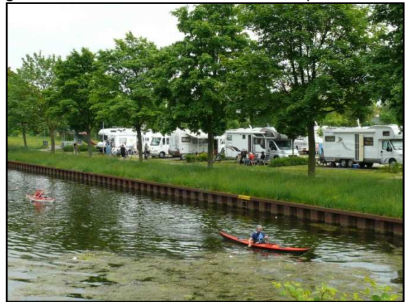
Campingplatz an der Spoy

Jenseits der Herzogbrücke soll eine lange von uns gehegte Vision Wirklichkeit werden: Freizeitschiffer legen fast in der Innenstadt an, man kann am Wasser wohnen oder auch studieren, denn die neuen Hochschulgebäude entstehen genau hier rund um den alten Hafenspeicher.