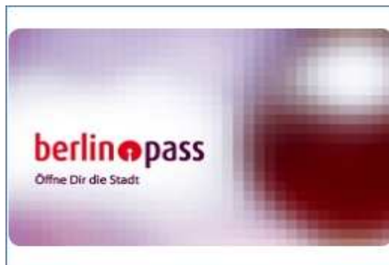
In Berlin bereits eingeführt: Pass für Bedürftige

Kleve darf nicht nur die Stadt der Kaufleute und der Reichen sein. Wir möchten eine möglichst große Teilhabe aller Bürger am sozialen und kulturellen Leben. Bedürftige, Arme und Schwache verdienen unsere Unterstützung.