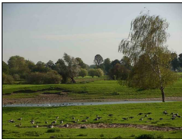
Magnet: Rheinauen und Düffel

Eine grüne Vision zur Errichtung eines grenzüberschreitenden Naturparks "Rhein-Niers-Waal" haben Bündnis 90/Die Grünen und Groen-Links aus der Region von Nijmegen und Kleve erarbeitet. Dieser Grenzpark nach dem Vorbild des Naturparkes Maas-Schwalm-Nette soll neue Impulse für den Naturschutz geben sowie eine Belebung des Tourismus und der Gastronomie bewirken.