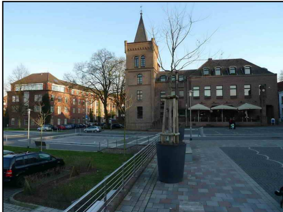
Heutiger Blick auf die Unterstadt

Das Rathaus wird saniert nach unserem Konzept der energetischen Gebäudesanierung mit einer Energiekostensparnis von ca. 8000.- Euro pro Monat.