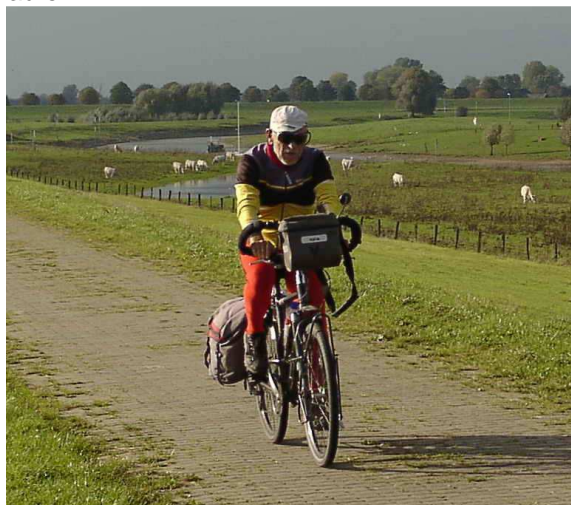
Fahren auf dem Deich – ohne Autoverkehr

Ganz wichtig ist uns Grünen die Schaffung von Radbahnen : Unabhängig von den Autostraßen soll der Radfahrer schnell quer durch die Stadt in andere Ortsteile gelangen können. Eine erste Radbahn wurde auf Antrag der Grünen schon verwirklicht : So lässt sich die Unterstadt über die Birnenallee in den Galleien schnell mit dem Sternbusch verbinden. Ein anderes Beispiel: Von der Wasserburgallee am Forstgarten sollte der Weg in die Innenstadt über eine Radbahn entlang der Bahngleise schnell und sicher ver- laufen.